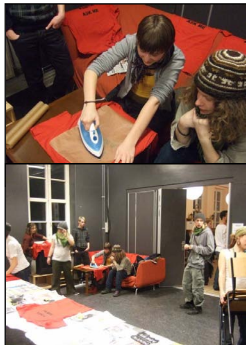
Tröjtryck på Ungdomens Hus i Simrishamn