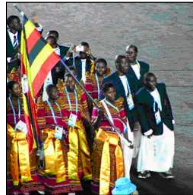
Invigning av Commonwealth Games