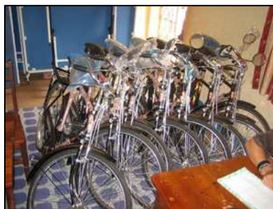
10 cyklar redo för att bringa inkomst som cykeltaxis.

erhålla det antal datorer klubben behöver till ett Internet-café och utbildning. Det som betalas är fraktkostnader vilket är 1000kr per data. Twiga har ordnat en separat insamling för ändamålet och kommer bistå med 10 datorer. Internet-café bringar inkomst, men framförallt får ungdomarna bra datakunskap och direktkontakt med andra länder genom e-post.